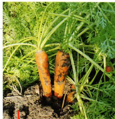
Optymalna wilgotność gleby w trakcie wzrostu marchwi procentuje plonem wysokiej jakości.

największego producenta tego warzywa w UE, z 12-procentowym udziałem w unijnej produkcji.