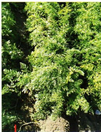
Marchew uprawiana jest najczęściej na redlinach, co w niektóre lata potęguje problem niedoboru wody.

Gatunek ten jest powszechnie uprawiany w Polsce. Według danych